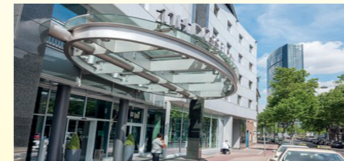
Veranstaltungsort: NH Hotel Düsseldorf City Nord, Münsterstr. 230-238