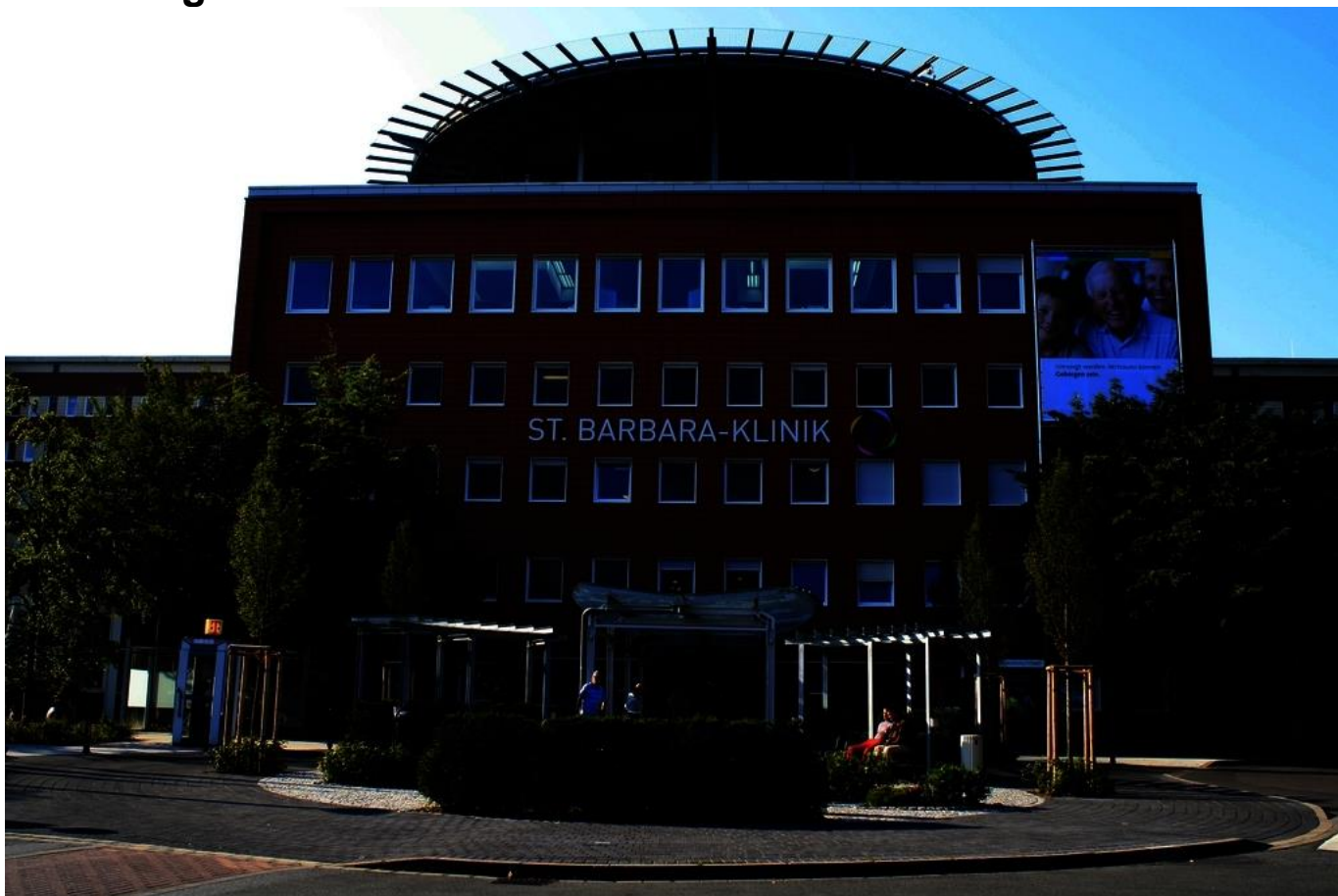
Abbildung: St. Barbara-Klinik Hamm GmbH

Die St. Barbara-Klinik Hamm GmbH mit den beiden Standorten St. Barbara-Klinik Hamm-Heessen und St. Josef-Krankenhaus Hamm-Bockum-Hövel ist als katholisches Krankenhaus eine der größten Einrichtungen der St. Franziskus-Stiftung Münster.